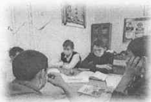
«Менің құқықтарым және міндеттерім» дөңгелек үстелі