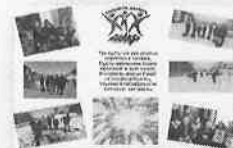
Балалар жасаған волонтер брошюралары