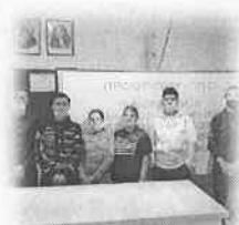
«Жасөспірім, құқықбұзушылық, жауапкершілік» дөңгелек үстелі