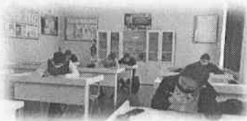
«Сен өз құқығыңды білесің бе?» сауалнамасын өткізу