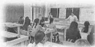
«Кәметке толмағандардың жыныстық қолсұғылмаушылығына қарсы қылмыстарын алдын алу» әңгімесі